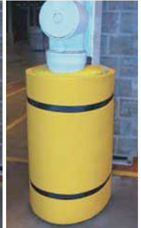
Geschützt mit Concrete Wrap